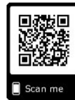
Vie de Bachir II

Pendant son règne, l'émir Bachir II vivait dans le palais Bayt et-Dine. Il construit de nouvelles routes et ponts pour faciliter les échanges. De plus, il s'allie au Pacha d'Egypte, Mohammad Ali, pour faire du Liban un état indépendant des ottomans. Suite à sa défaite en 1840, il est exilé en 1841 et le Mont-Liban est supprimé par les ottomans.