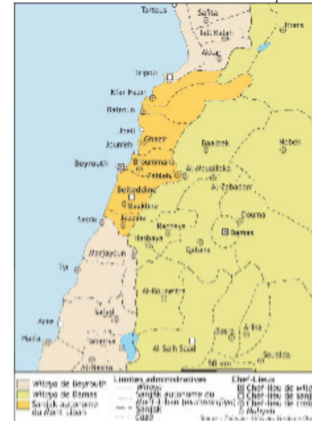
Emirat du Mont-Liban

-L'Empire ottoman est dirigé depuis Istanbul -Il est divisé en provinces (wilayas) dirigés par des walis (= pachas ou émirs) -Les Mutaqatajis sont des nobles qui aident les walis à gouverner l'émirat du Mont-Liban