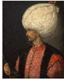
Soliman le Magnifique (Selim Ier)

Le sultan ottoman Selim Ier (= Soliman le Magnifique) défait l'armée Mameluk. 1516